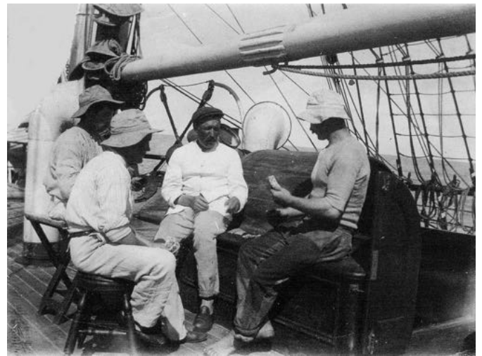
Pétrole, on joue aux cartes pour ne pas perdre patience.

Dimanche 24 septembre : Beau temps tout à fait lourd. On a joué aux cartes toute l'après-midi, on n'avance pas beaucoup. Le soir la brise fraîchit et le temps se couvre. Vivement Frisco, ce que l'on a hâte d'être arrivés.