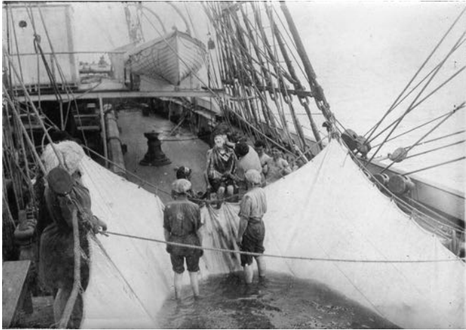
Certains marins disent « j'ai été baptisé une deuxième fois ».

Mercredi 13 septembre : Le beau temps continue, on étouffe, on passera l'Équateur ce soir. Notre bordée est de lavage demain, gare la douche, c'est un vrai bonheur dans ces pays-ci. Hier je me suis battu à coups de seaux d'eau avec le mousse, oh ! la rosse, il est méchant. Je l'ai trempé comme une soupe, et il n'a réussi à me mouiller qu'un bras. De rage, il a pris mon oreiller et a été le cacher alors on a accroché sa paillasse, sa couverture et son oreiller dans la mâture, il a été la matinée à les chercher et ne les voyait pas.